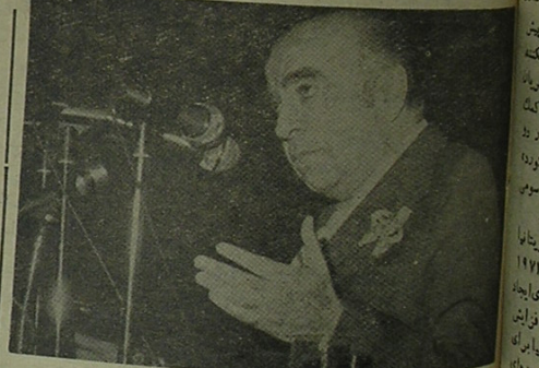
هویدا نخست وزیر هنگام ایراد نطق در اجتماع مسئولان حوزه های حزب بقیه در صفحه ۲

ایران، به آلمان غربی اخطار کرد، تنها تا ششم اسفند، منتظر تصمیم نهائی آن کشور درباره توافق احداث پالشگاه بندر بوشهر می ماند. در این کار، اذیت تجربیه و شناختی که ایران از آلمانی ها دارد، بیک اقدام بجای بود. آلمانی ها، این بار اول نیست که با ایران در اجرای طرح ها و برنامه ها، بدقتی می کنند، بقیه در صفحه ۴