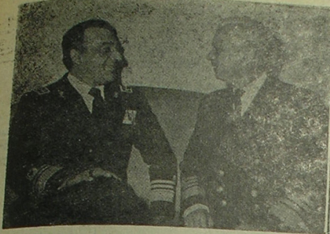
فرمانده نیروی دریایی جدید بملاقات با فرمانده نیرو دریایی شاهنشاهی ایران

در حالی که مشرب بی ایهام و روشن ایران بردنیا ملوم است، سیمای حادثه آفرینی و فتنه انگیزی بغداد نیز بر دنیا پوشیده نیست و حلاله که بعثی های نابکار بغداد، از خود چنین گستاخی نشان میدهند، بر سازمان ملل متحد و شورای امنیت که دفاع از صلح را بعهده دارد، فرض است که توجه خاص به عواقب وخیم تیکاریهای رژیم بعثی بنسداد بکنند و شرایین حادثه آفرین دینامیتی قتل انگیزی و توطئه را از سر خاورمیانه و منطقه و خلیج فارس کم کنند و راه اخلاص و نامنی را به بندند.