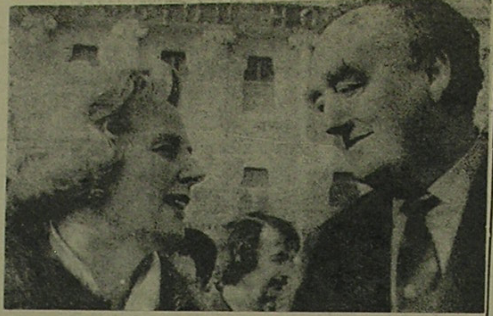
ایست بون، انگلستان - خانم مارگارت تاجر، و ویلیام ویلایام، دو کاندیدای حزب محافظه کار برای رهبری این حزب، در روزی هم قرار گرفتند. این دو رقیب اندکی پیش از گرفتن عکس، در کنفرانس جوانان حزب شرکت کرده بودند

وزیر دفاع هند اعلام کرد کارخانه های هند اسلحه مورد نیاز ارتش این کشور را تأمین میکنند. وی تأکید کرد هند دیگر احتیاج به خرید اسلحه حتی هواپیما از خارج ندارد.