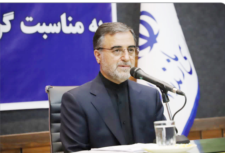
نماینده‌ی کشور برای راه‌اندازی کپردور شمال جنوب برعهده خواهیم داشت.

ارتباط دو و چند جانبه نیز در این دولت اتفاق افتاد.