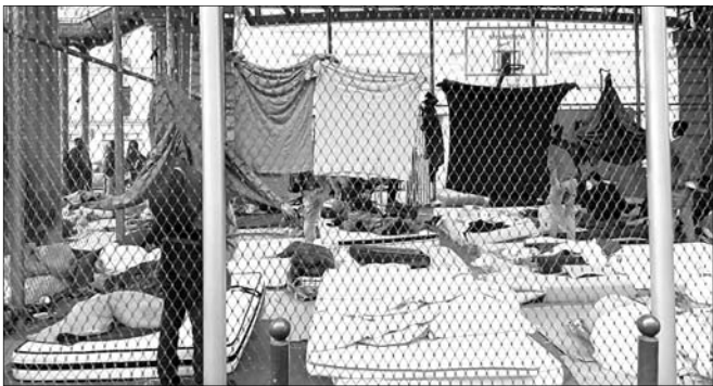
بی‌خانمان‌ها روی تشک‌های کهنه و مقوا نزدیک ایستگاه مترو استالینگراد در شمال شرقی پاریس می‌خوابند.