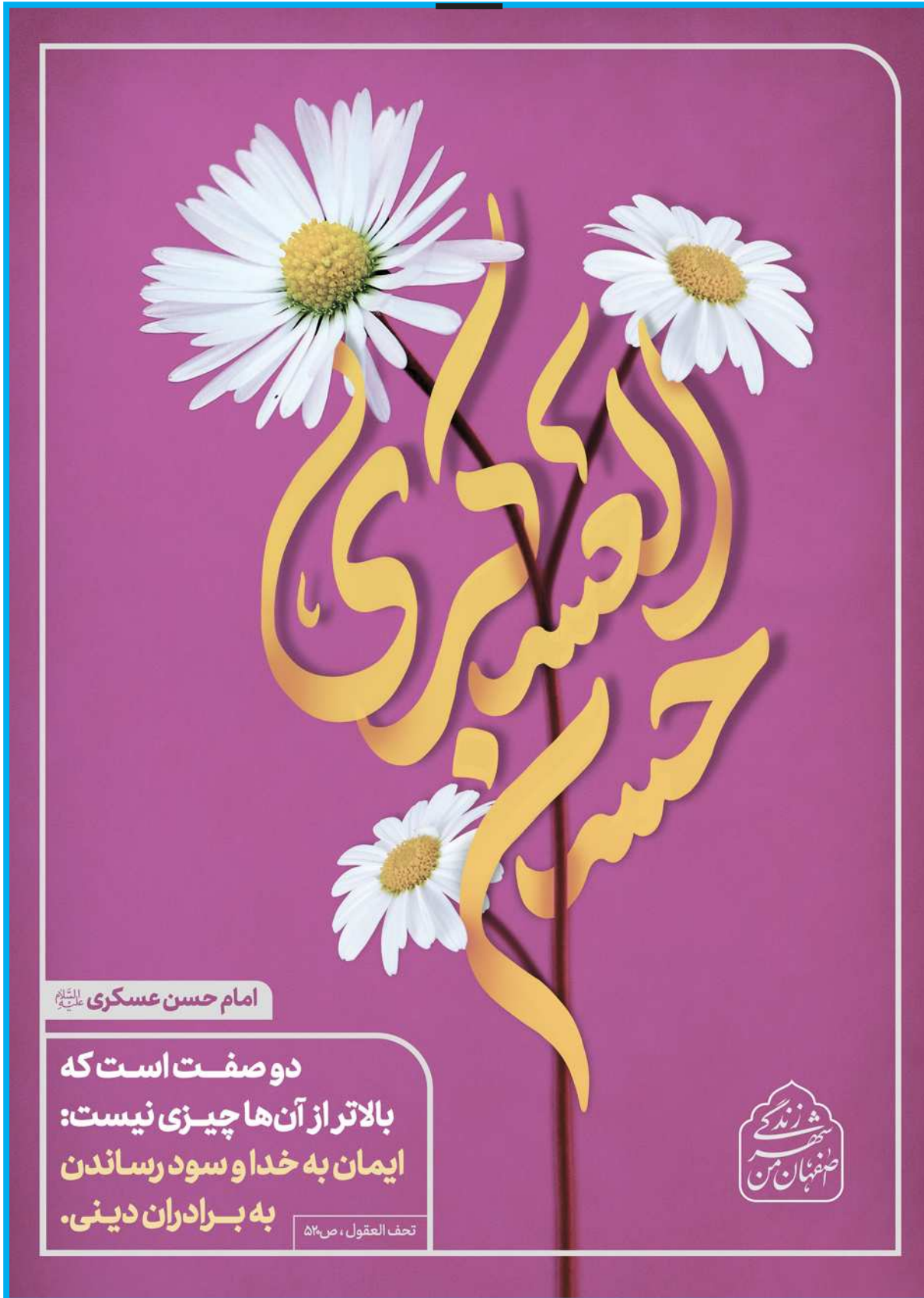
امام حسن عسکری علیه السلام

دو صفت است که بالاتر از آن‌ها چیزی نیست: ایمان به خدا و سود رساندن به برادران دینی.