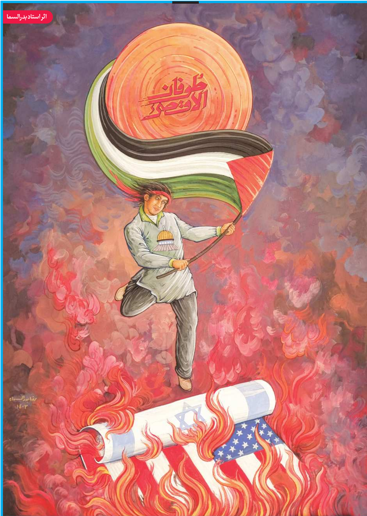
اثر استاد بدرالسماء