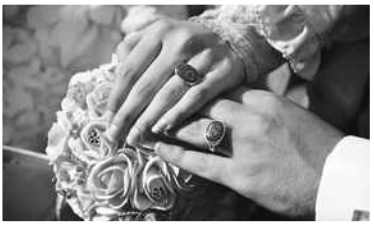
مراسم عقد یک زوج جوان در تهران.

مدیر اداره اعتبارات بانک مرکزی اعلام کرد: از ابتدای امسال تا ۳۰ مهرماه به یک میلیون و ۲۱۲ هزار و ۵۱۱ متقاضی وام ازدواج و فرزند و ودیعه مسکن، بیش از ۱۴۱ هزار میلیارد تومان تسهیلات توسط شبکه بانکی پرداخت شده است.