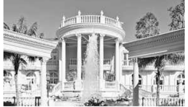
نمای دروازه ورودی مجتمع مسکونی «پارسیان» در تهران