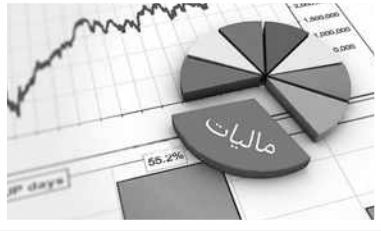
نمودار گویای تقسیم بدهی مالیات‌های مستقیم