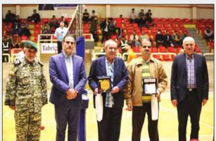
ورزش تجلیل کرد.

عصر آزادی / سرویس ورزشی: به مناسبت هفته تربیت بدنی، باشگاه مس سونگون در جریان دیدار هفته ششم تیم والیبالیست مقابل نیروی زمینی تهران، از پیشکسوتان عرصه ورزش تجلیل به عمل آورد.