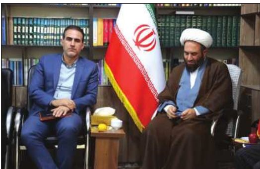
مرکزی باشگاه به شهر ورزشان شدم و به صورت جدی پیگیر این موضوع هستم و اولویت تیمداری و هزینه باشگاه مس سونگون ورزشان،