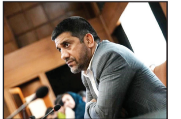
رئیس فدراسیون کشتی

بعد از اعلام ابطال انتخابات فدراسیون کشتی، واکنش‌های بسیاری از سوی افراد و مسئولان مختلف دیده شد. در نهایت اما علیرضا صدابریس رییس این فدراسیون روز گذشته به این موضوع ورود کرد و به آن واکنش نشان داد. دبیر که راهی یک برنامه تلویزیونی شده بود، در این خصوص گفت: «دادگاه عمومی به موضوع انتخابات کشتی ورود کرده و حکمی داده است. قوه قضائیه محترم است و ما حتماً به این حکم اعتراض می‌کنیم. اینکه ایس‌ان دادگاه می‌تواند به این مسائل ورود کند یا خیر، برای ما شفاف نیست چون این موارد در صلاحیت دیوان عدالت‌داری است. من به افرادی ربط باج نمی‌دهم و روحیه ما همین طور است، ولی قوه قضائیه را احتمالاً دنبال خواهیم کرد. افرادی که به اساسنامه انتخابات فدراسیون اعتراض کردند یک بازی را شروع کردند که آن را به اتحادیه جهانی بکشاند. ما هم حواسمان به این مسائل هست و اجازه نمی‌دهیم این اتفاق بیفتد. با همین اساسنامه‌ای که مورد اعتراض نامزدها قرار گرفته سه انتخابات ۲۰ مجمع برگزار شده است، چرا تا به حال تخلف نبوده است؟! دوستان خود این نامزدها با همین اساسنامه انتخاب شدند. دوره قبل خود هم با همین اساسنامه انتخاب شد. این اساسنامه هفت سال است که مرجع فدراسیون کشتی است و اگر این طور باشد در همین سال‌ها شائبه صورت گرفته است»