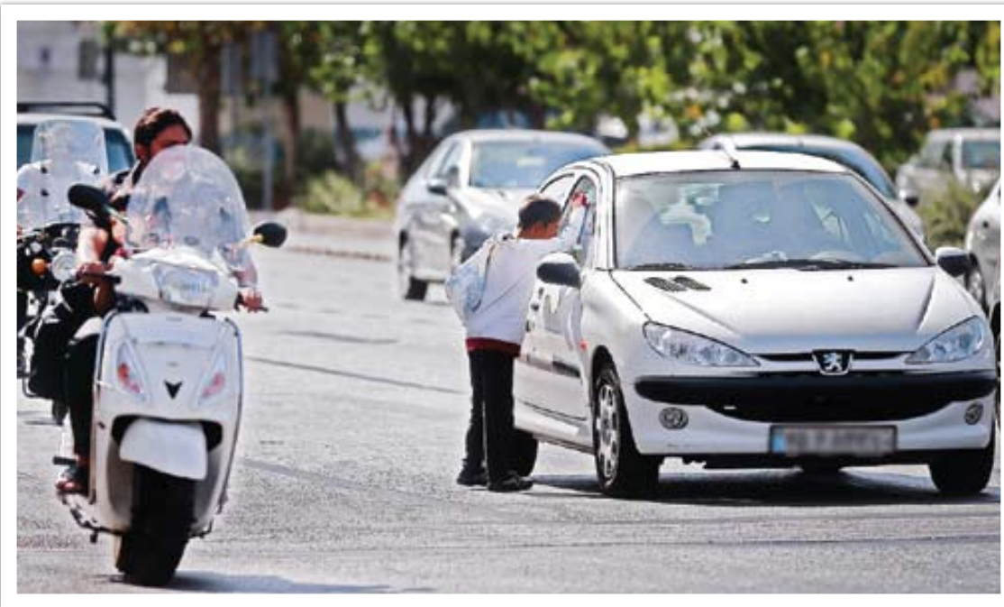
پدیده بانندی هر روز گسترده‌تر می‌شود

تکدی‌گری اگرچه در قانون، جرم تلقی می‌شود و مجازات دارد اما مردم نباید منتظر اجرای این قانون باشند و باید خودشان با تعقل و خودداری از کمک به متکدیان حرفه‌ای و سمت و سو دادن کمک‌های مالی خود به فقیران واقعی مانع رواج تکدی‌گری شوند