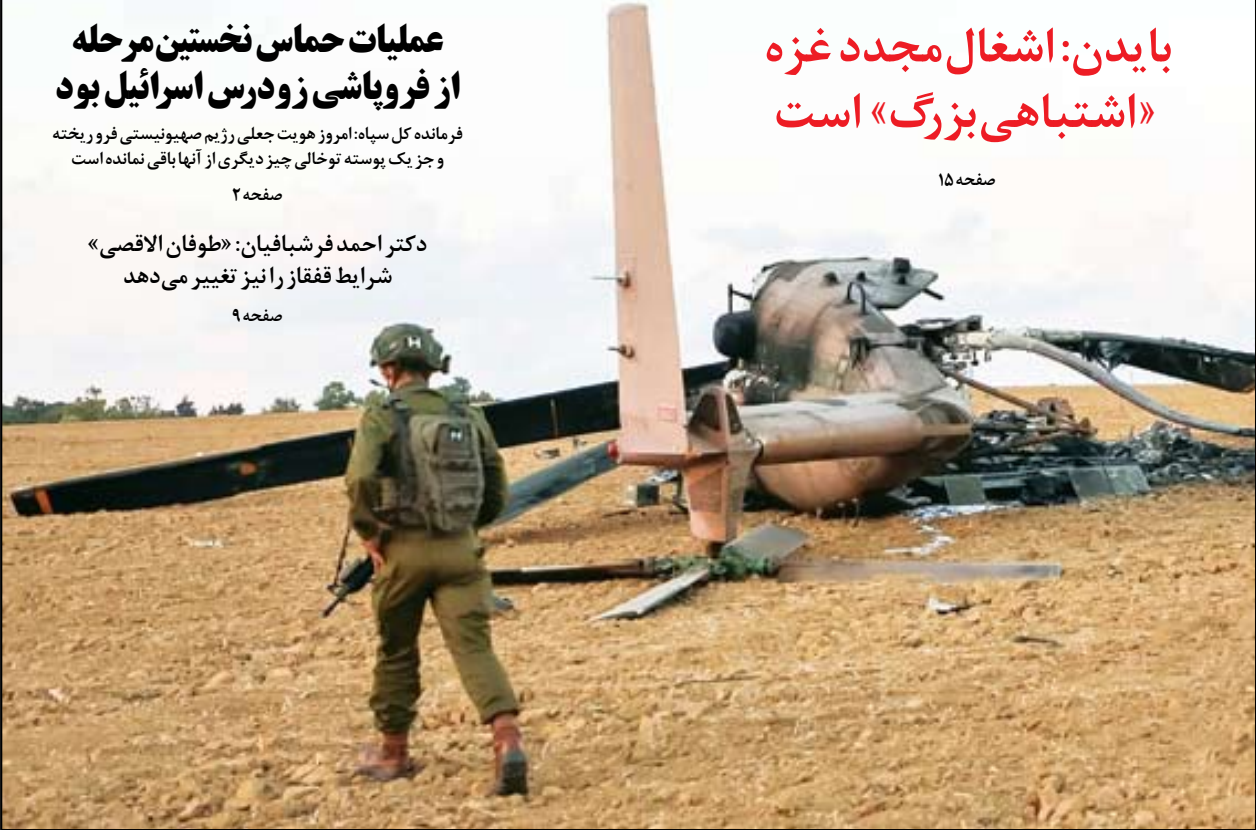
آیا بین هشدارها و ضرب‌الاجل‌های ایران درباره حمله زمینی به غزه و توضیحات بایدن درباره اشتباه بودن اشغال غزه، رابطه مستقیم برقرار است؟!