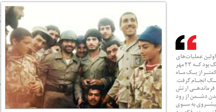
سردار علیرضا سجادی در کنار همکارانش

بنی‌صدر بعد از عملیات توکل که اواخر دی ماه بود، به تهران برگشت و وارد حاشیه‌های سیاسی شد و نهایتاً ۲۰ خرداد ۱۳۶۰ از سمت فرماندهی کل قوا برکنار شد. بعد از رفتن بنی‌صدر، اتحادی بین ارتش و سپاه و نیروهای مردمی صورت گرفت. نتیجه این پیوند میمون، عملیات نامن‌الانمه(ع) یا همان شکست حصر آبادان بود. پیشتر عنوان شد که بنی‌صدر دو عملیات برای شکست حصر آبادان انجام داد که هر دو شکست خوردند، اما در عملیات نامن‌الانمه(ع) مهر ۱۳۶۰، یعنی تقریباً سه ماه بعد از فرار بنی‌صدر، حصر یک‌ساله آبادان شکست و دشمن اولین شکست سخت خورد را تجربه کرد. از اینجا به بعد، دور پیروزی‌های ایران شروع شد. عملیات طریق‌القدس (آزادسازی بستان)، فتح‌المبین و نهایتاً اly بیت‌المقدس و فتح خرمشهر یکی بعد از دیگری شکل گرفتند و دشمن را از عمده متصرفاتش در خاک ایران بیرون راندند. بعد از فتح خرمشهر نوبت به سیاست تعقیب تنبیه متجاوز رسید، یعنی کار به جایی رسید که ما علاوه بر بیرون راندن دشمن از خاکمان می‌بایست او را در خاک خودش تعقیب می‌کردیم. البته عراق بعد از شکست در خرمشهر یک عقب‌نشینی سراسری هم انجام داد، اما همچنان ۲ هزار و ۵۰۰ کیلومتر از خاک ما را در بلندی‌ها و مناطق استراتژیک در تصرف نگاه داشت که ما می‌بایست علاوه بر اخراج او از این مناطق دشمن را در خاک خودش تعقیب و تنبیه می‌کردیم.