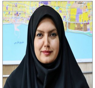
به قلم: مریم پاسالار / سردبیر

پروتئین، کربوهیدرات، چربی، ویتامین ها و مواد معدنی مورد نیاز بدن کودک را تامین کرده و احتمال ابتلا به بیماری های مختلف را در آینده کاهش می دهد. با رعایت و توجه به تغذیه سالم برای کودکان در طولانی مدت به افزایش طول عمر و افزایش کیفیت زندگی کمک می کند؛ و می تواند زندگی سالم تر و بهتری را تجربه کنند.