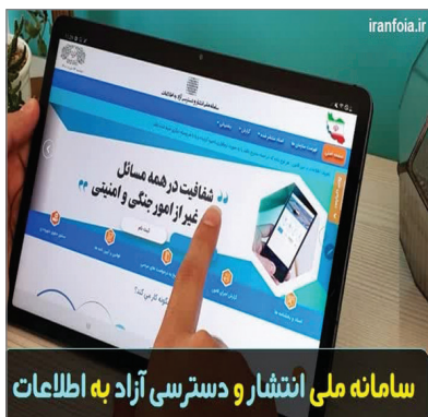
سامانه ملی انتشار و دسترسی آزاد به اطلاعات

سرورس اجتماعی- با اعلام مشاور وزیر و مدیرکل دفتر ارتباطات مردمی و سفرهای استانی وزارت جهاد کشاورزی اداره روابط عمومی سازمان جهاد کشاورزی استان هرمزگان با توجه به عملکرد مناسب در سامانه انتشار و دسترسی آزاد به اطلاعات