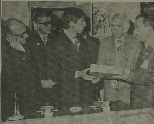
والاحضرت ولایتعهد دیروز در مراسم دوازدهمین سالگرد سپاه ترویج و آبادانی شرکت کردند

راه حل میانه‌ای برای از بین بردن قیمت دو گانه نفت در اوپک پیدا شده که اگر کشورهای اوپک موافقت کنند ما نیز موافق آن هستیم • وزیر نفت قطر برای یک راه حل میانه با کشورهای اوپک در تماس است صفحه آخر