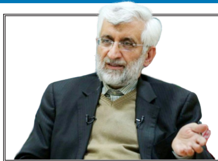
عضو مجمع تشخیص مصلحت نظام گفت: دشمن در پی آن است که یقین و آرمان یک ملت را دچار تردید کرده و نقاط قوت را پوشانده و نقاط ضعف را برجسته کند.

دشمن در پی آن است که یقین و آرمان ملت ایران را دچار تردید کند