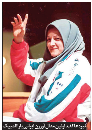
نیره عاکف، اولین مدال آورزن ایرانی پارالمپیک

ورزش‌های جانبازان و معلولین با مأموریت جدیدی برای جذب و حمایت از این گروه، مسئولیت سنگین‌تری را برعهده می‌گیرد. در ادامه در سال ۱۳۷۷ نیز با توسعه کمی و کیفی ده‌ها رشته ورزشی و افزایش تعداد ورزشکاران، فدراسیون ورزش‌های نابینایان و کم‌بینایان، از فدراسیون جانبازان و معلولین جدا شده، فعالیت خود را به صورت مستقل آغاز می‌کند. در همین سال، همچنین با تأکید کمیته بین‌المللی پارالمپیک (IPC) بر تشکیل کمیته ملی پارالمپیک (NPC) در ایران، فرآیند تأیید و تأسیس این کمیته در کشور آغاز و دو سال بعد کمیته تشکیل می‌شود. در سال ۱۳۹۵ نیز پس از سال‌ها پیگیری، کمیته ملی پارالمپیک از کمیته ملی المپیک، جدا می‌شود و به‌صورت مستقل درمی‌آید.