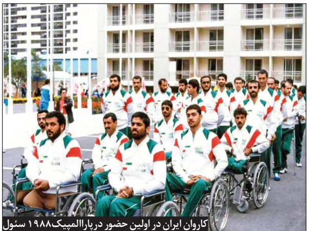
کاروان ایران در اولین حضور در تبار المپیک ۱۹۸۸ سنئول