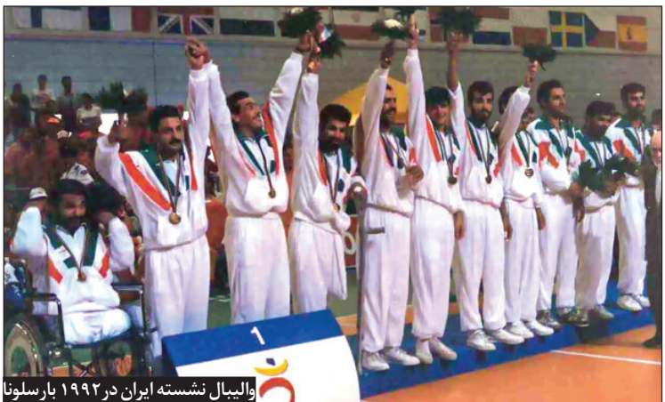
والیبالیال نشسته ایران در ۱۹۹۲ بار سلوننا