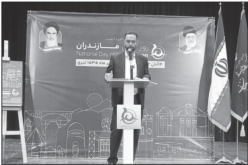
مدیرکل فرهنگ و ارشاد اسلامی مازندران: