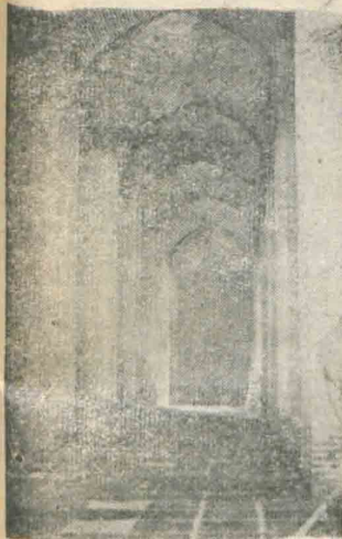
قسمتی از نمای داخلی وستونهای آب انبار

بوسیله جناب آقای سید ضیاء الدین طباطبائی