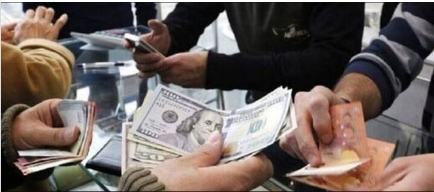
وضعیت قیمت‌ها در بازار طلا و ارز