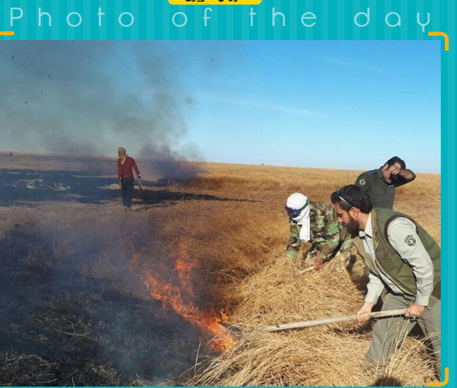
آتش سوزی در بیستر خشکیده تالاب بین‌المللی هامون با تلاش یگان حفاظت محیط زیست شهرستان زابل و منابع طبیعی شهرستان نیرمزو مهار شد.