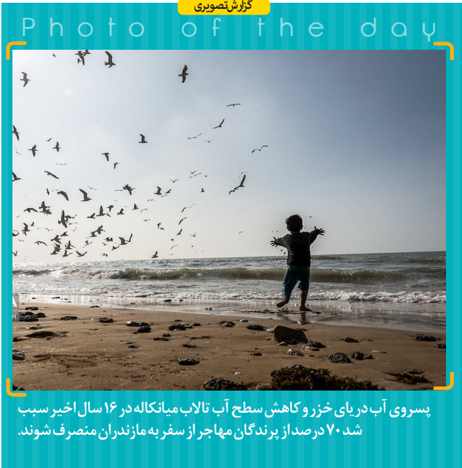
پسروی آب در بای خزر و کاهش سطح آب تالاب میانکاله در ۱۶ سال اخیر سبب شد ۷۰ درصد از پرندگان مهاجر از سفر به مازندران منصرف شوند.