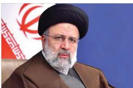
وزارتخانههای آموزش و پرورش، علوم، تحقیقات و فناوری و بنیاد شهید و امور ایثارگران نیز در این جلسه مطرح و مورد تبادل نظر قرار گرفت.

سید ابراهیم رئیسی بعد از ظهر شنبه در ششمین جلسه شورای عالی اشتغال در دولت سیزدهم، با تاکید بر اجرای به موقع قوانین مصوب مربوط به اشتغال از سوی دستگاههای مرتبط، آسیبشناسی وزارتخانههای کم کار در ایجاد اشتغال را خواستار شد. رئیسی با بیان اینکه اعتبارات شرط لازم برای ایجاد اشتغال است.