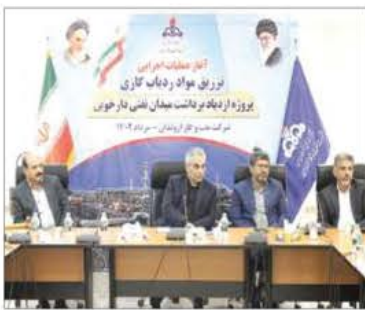
تشریح و قنبری در این باره توضیحاتی درباره

مدیر پژوهش و فناوری شرکت ملی نفت ایران در این باره اظهار کرد: پروژه تزریق مواد ردیاب گازی در شرکت نفت و گاز اروندان اولین پروژه از پروژه‌های میدان محور است که به آزمایش میدانی رسیده و با انجام آن برای نخستین بار در کشور، در این زمینه منحصر به‌فرد بوده و از مدیرعامل این شرکت و دانشگاه صنعتی امیرکبیر به‌عنوان مجری طرح