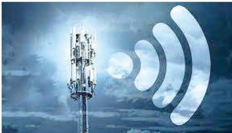
سیار با بیش از ۱۰۵ میلیون و ۱۸۰ هزار مشترک از ۱۲۴ درصد و ضریب نفوذ اینترنت ثابت با بیش از ۱۱ میلیون و ۵۴ هزار مشترک از ۱۲ درصد عبور کرده است. این آمار پهنای باند

۸۲ میلیون و ۳۳۶ هزار و ۶۲۵ نفر بود که باعث شد ضریب نفوذ کل پهنای باند اینترنت کشور از ۹۶ درصد عبور کند. در آغاز به کار دولت سیزدهم، «عیسی زارع پور» وزیر ارتباطات و فناوری اطلاعات به برنامه‌های پیش‌بینی خود برای ارتقا وزارتخانه به استفاده حداکثری از فناوری اطلاعات و ارتباطات و ظرفیت‌های فضای مجازی برای رسیدن به ایرانی هوشمند در تراز انقلاب اسلامی در افق ۱۴۰۴ اشاره کرد. وزیر ارتباطات در این برنامه حکمرانی دیجیتال و تعاملات بین‌المللی، شبکه ملی اطلاعات و توسعه پایدار زیرساخت‌های ارتباطی، دولت هوشمند و تحول دیجیتال، تنظیم مقررات حوزه ارتباطات و فناوری اطلاعات، اقتصاد دیجیتال، حفظ حریم خصوصی و امنیت فضای تبادل اطلاعات، شتابدهی رشد صنعت فضایی و خدمات پستی و مالی را از موضوعات مهم این حوزه عنوان کرد. اکنون با گذشت حدود ۲ سال از آغاز به کار دولت سیزدهم، برخی از شاخص‌های آماری با پیشرفت مواجه شده‌اند. در فصلنامه ارتباطات و فناوری اطلاعات مربوط به پایان زمستان ۱۴۰۱، شاخص‌های آماری نشان می‌دهد ضریب نفوذ اینترنت