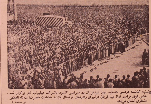
بجشن عید قربان در سراسر کشور تظاهرات وسیع برگزار شد