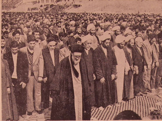
محنه ای از زمان دعوت آیت الله قاضی طباطبایی ساعتی قبل از ترور در ورزشگاه تختی تبریز برگزار شد.

فانواده آیت الله قاضی طباطبایی، گروه فرغان در مراسم رسیدن شاندار آذربایجان شرقی ۳ روز پیش در تبریز استقبال کرد. فرزند آیت الله حاج محمد تقی طباطبایی، گروه فرغان در تبریز استقبال کرد. فرزند آیت الله حاج محمد تقی طباطبایی، گروه فرغان در تبریز استقبال کرد.