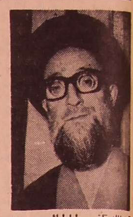
آیت الله قاضی طباطبائی