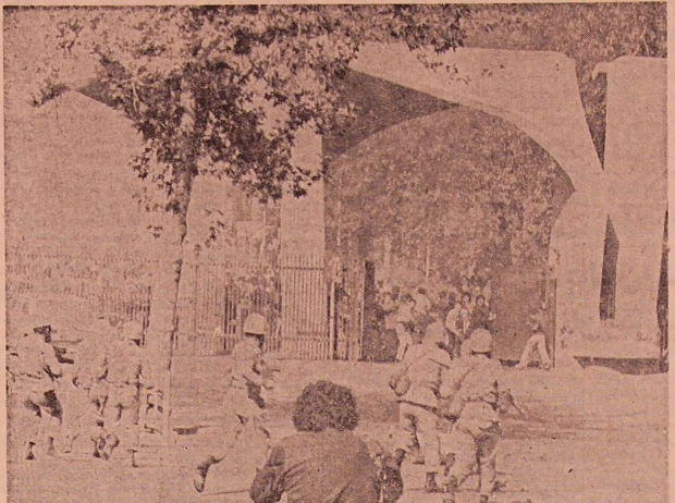
سربازان فرمانداری نظامی تهران غنای به دست‌آمده‌های دانشگاه نزدیک شدند دانش آموزان و دانش‌جویانی را که در داخل دانشگاه تهران سرگرم تظاهرات استقامت‌آمیز بودند با مسلسل به رگبار گلوله بستند.

فردا سالروز فاجعه خونین دانشگاه تهران این سکر آزادی و آزادیگانه است. سالیان دراز دانشجویان سربازان فرمانداری نظامی فرمان جبهه پویانان در زلزله‌های سراسر دهه ۴۰ دانشگاه تهران را پرگسار گلوله بستند و سینه‌انتهای و دانش آموزان بخشم آمده از استبداد و استعمار را آماج سربازان کردند.