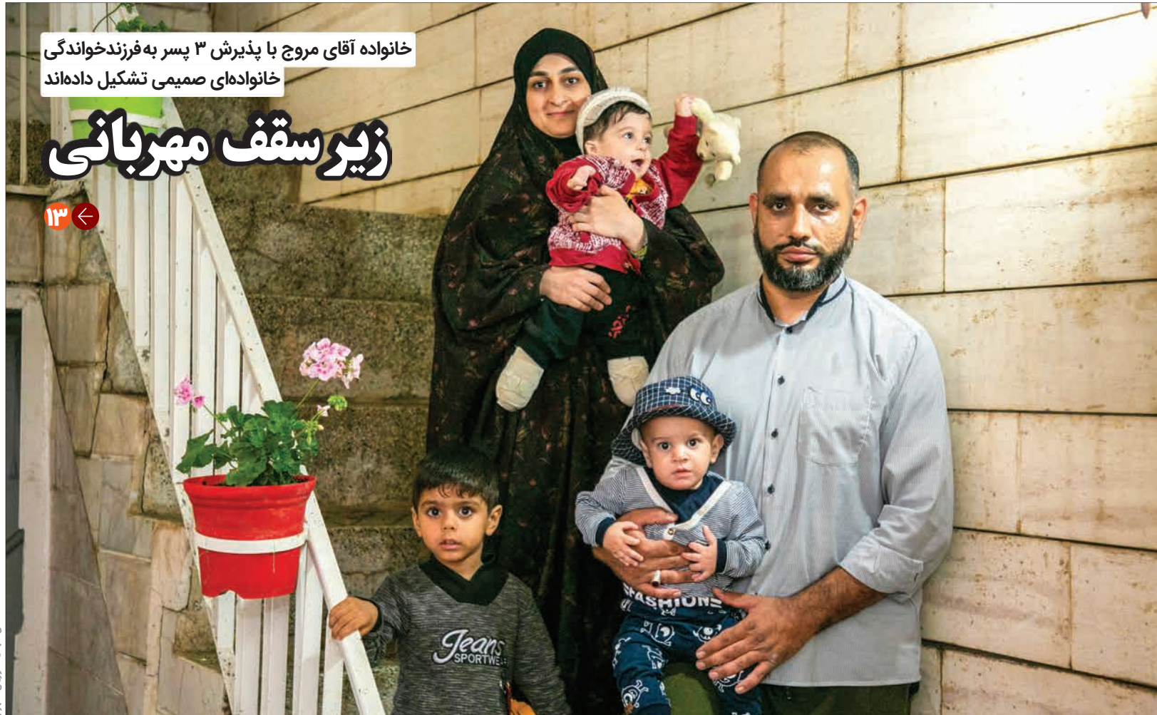
خانواده آقای مروج با پذیرش ۳ پسر به فرزندخواندگی خانواده های صمیمی تشکیل داده اند

در آخرین سال مجلس یازدهم، مردم استان از نمایندگان خود انتظار پیگیری و نتیجه دارند