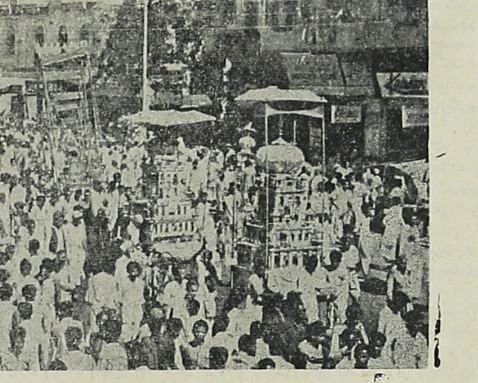
روز عاشورا بیش از یکصد هزار نفر از اهالی پاکستان در حالی که گنبد بارگاه حضرت سید الشهدا بر سر دست داشتند در خیابانهای کراچی راه اقتضاند

جریانی که باعث شده است کارکنان جریده شریفه دنبارا در دوسر بدهم مطلبی