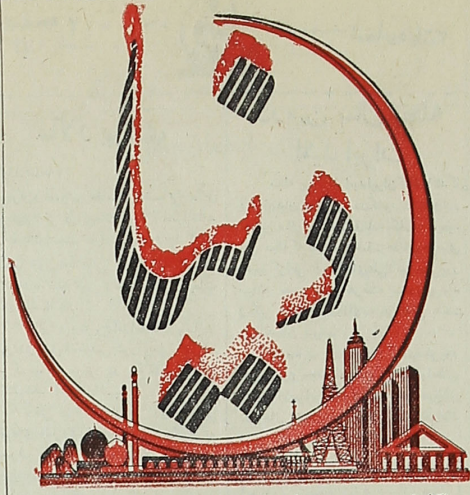
نگارنده و مدیر مسئول و سردبیر: سید عبدالحکیم طباطبائی