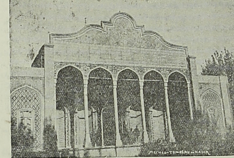
آرامگاه فعلی نادر شاه در مشهد مانیکه معمور بود

تظمی مورد موافقت قرار گرفت دستور اجرا آزا صادر و برای همین منظور و نظر بقدرت بود این چند روز قبل آفاتی مهندس سیون و مهندس صدیقی بطرف مشهد رهبران شدند.