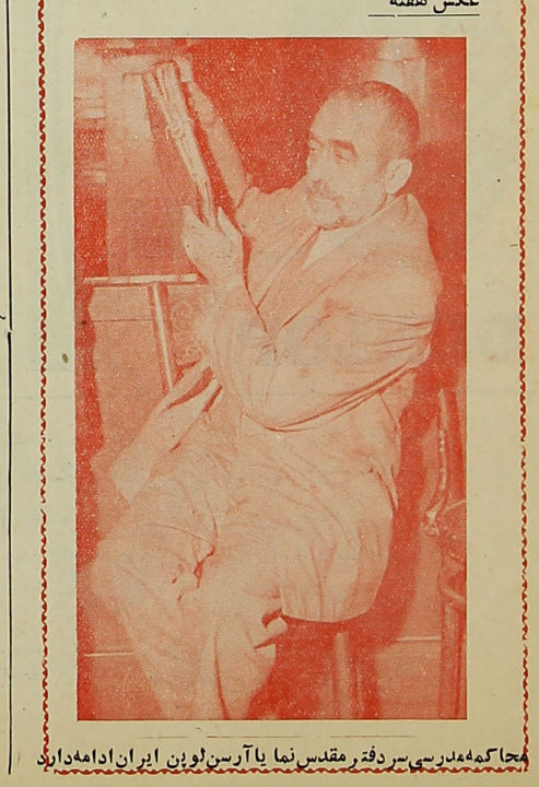
محاکمه مدرس در دفتر مقدس نما یا آرسن لوین ایران ادامه دارد