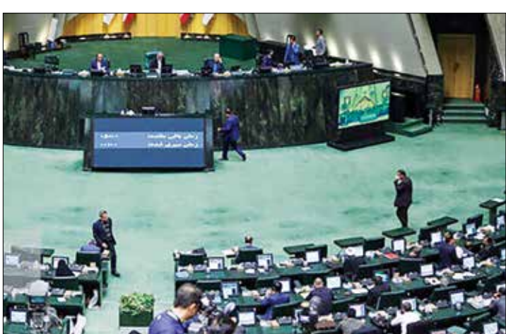
اجرائی این ماده ظرف سه ماه پس از لازم الاجرا شدن از طریق پلتفرم های مذکور فراهم کند. طبق خبری که ایسنا منتشر کرده است «آیین نامه

مجلس وزارت ارتباطات و فناوری اطلاعات امکان استفاده از سایل نقلیه موتوری را به بخش خصوصی باز کرد. در جلسه علنی دیروز، چهاردهم آبان ماه، گزارش کمیسیون تلفیق لایحه برنامه هفتم توسعه را بررسی کرده و در نتیجه آن ماده الحاقی ۲۳ این لایحه را تصویب کردند. با تصویب این لایحه وزارت ارتباطات مکلف شد با همکاری نهادها و سازمان های دارای اطلاعات مربوط به وسایل نقلیه موتوری، امکان استفاده از سایل نقلیه موتوری، امکان مورد معامله را برای پلتفرم های بخش خصوصی فراهم کند. در این ماده الحاقی در راستای اجرای قانون مدیریت داده ها و اطلاعات ملی مصوب ۳۰/۶/۱۴۰۱ و با هدف پیشگیری از جرائم و ارتقای سلامت معاملات وسایل نقلیه موتوری،