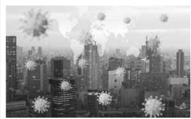
گلشن سیدی نویسنده

اپیدمی کرونا حدوداً یک سالی می‌شود که ظاهرادر سرتاسر جهان تمام شده و حالا محققان و پژوهشگران حوزه‌های مختلف به دنبال آن هستند تا تأثیراتی که این تحول بزرگ بر ابعاد مختلف زندگی آدم‌ها از خود نشان داد را به رشته تحلیل و بررسی درآورند. شهرسازی نیز از حوزه‌هایی است که شیوع گسترده کرونا توانست تأثیراتی بر ساختار آن بگذارد. به همین بهانه مروری داشته‌ایم بر نظریات «نورمن رابرت فاستر» معمار و شهرساز مشهور بریتانیایی که شخصیتی پیشرو در زمینه معماری پایدار شناخته می‌شود و برنده ده‌ها جایزه بین‌المللی در زمینه معماری و شهرسازی است. طرح گنبد مجلس ملی آلمان در برلین و بنای مشهور به «خیارشور» در لندن از آثار مهم اوست.