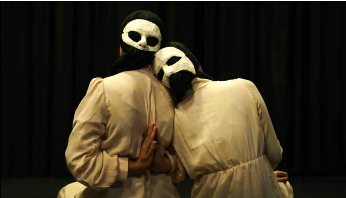
عکس‌هایی از تیزرهای نمایش امروز

بازیگری است چون بازیگر باید این توانایی را داشته باشد که مخاطب را از چهار طرف با خودش همراه کند.