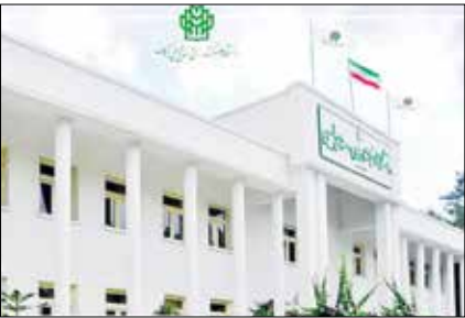
عکس: رویداد امروز

بر اساس رتبه‌بندی انجام شده توسط مؤسسه رتبه‌بندی تایمز در سال ۲۰۲۴، دانشگاه علوم کشاورزی و منابع طبیعی گرگان موفق شد در اولین حضور خود در این رتبه‌بندی، رتبه ۴۰۱ تا ۵۰۰ را در بین برترین دانشگاه‌های جهان و رتبه اول را در بین دانشگاه‌های کشور در زمینه علوم زیستی کسب نماید. طبق گزارش مؤسسه رتبه‌بندی تایمز که در زمینه علم‌سنجی و رتبه‌بندی دانشگاه‌های جهان فعالیت دارد دانشگاه علوم کشاورزی و منابع طبیعی گرگان در موضوعات مورد بررسی حاضر رتبه‌های مناسبی در سطح جهان شد. دانشگاه علوم کشاورزی و منابع طبیعی گرگان در زمینه علوم زیستی (شامل علوم بیولوژیکی، علوم