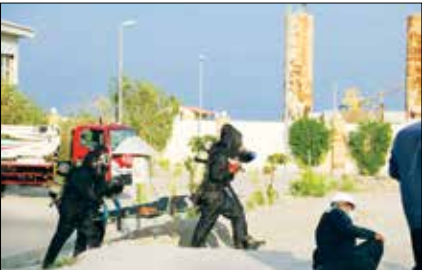
عکس: رویداد امروز