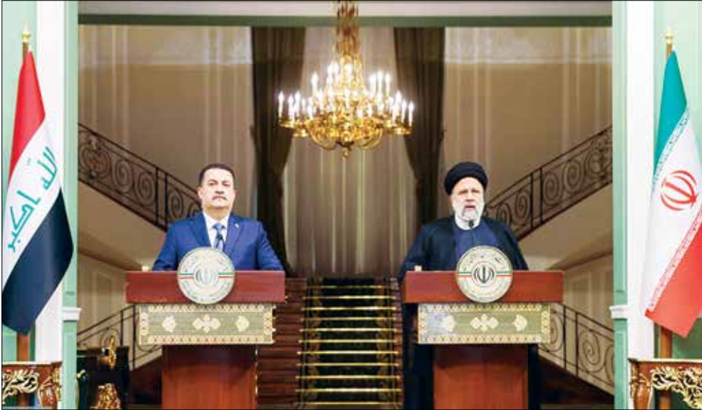
رئیس‌جمهور وقت، هرگونه اقدامی که در سطح

کشورهای اسلامی، در سطح کشورهای منطقه و بین‌الملل برای جلوگیری رژیم صهیونیستی و هیئت حاکمه آمریکا از قتل و کشتار مردم بی‌گناه، مظلوم و مقتدر غزه انجام شود همکاری و حمایت می‌کنیم. به گزارش ایرنا، سید ابراهیم رئیسی در نشست مطبوعاتی مشترک با «محمد شیاع السوداني» نخست‌وزیر عراق با بیان اینکه در حوزه مسائل سیاسی روابط بین دو کشور روزبه‌روز در حال ارتقا است، تصریح کرد: یکی دیگر از عرصه‌ها همکاری میان دو کشور در حوزه مسائل امنیتی بوده و باید از همت و تلاش سودانی برای اجرای قرارداد امنیتی‌فی‌مابین قدردانی کنم.