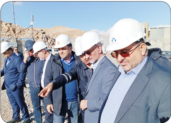
گلشنی «رئیس سازمان صنعت، معدن و تجارت استان زنجان، رئیس هیات عامل ایمیدرو را همراهی کردند.

است که باید از آن برای ثروت‌زایی استفاده کرد تا این زنجیره تداوم یابد؛ که یکی از راه‌های ثروت زایی، سرمایه‌گذاری است.