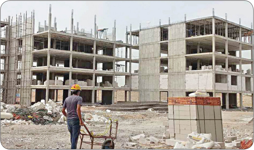
بانکی جاری بهره‌بردار. علاوه بر آن، تأمین مصالح ساختمانی نیز با ایجاد هم‌افزایی بین نهادها و در عمل دشوار است امامی توانست با افزایش تولید، نظام

این تمرکز که توجیه منطقی هم داشت و دارد، اما سبب غفلت از برخی حوزه‌ها و به‌طور خاص در اقتصاد شد در حالی که در دنیای امروز اقتصاد یکی از ارکان تأثیرگذار در عرصه‌های بین‌المللی سیاسی، نظامی و امنیتی است. گرچه در سه دههٔ اول انقلاب کشور با خام‌فروشی که به‌نوعی ارزان‌فروشی منابع به‌ویژه نفت و هدر دادن آنهاست، توانسته بود بخشی از هزینه‌های خود را تأمین کند اما به تدریج خلاهای موجود در اقتصاد پررنگ‌تر شد و فضای غبار آلود اقتصاد و خطاهای استراتژیک بروز و ظهور پیدا کرد و اقتصاد به پاشنه آشیل حکمرانی تبدیل شد. این بود که رهبری در یک دهه گذشته، شعار سال را با محوریت اقتصاد و با حوزه‌های مرتبط با آن انتخاب کردند و مسئولان نیز نگاه جدی‌تری به بخش داشتند. با این حال اما همچنان اقتصاد ایران به صورت بنیادین با مشکلات زیادی مواجه است که یکی از آنها خودتجمع نظام مسائل آن است.