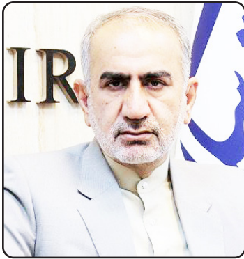
عضو کمیسیون برنامه و بودجه مجلس: