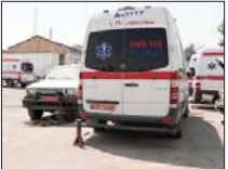
وضعیت آمبولانس‌های اصفهان هنوز آزرسانی است