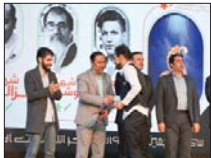
جشنواره تئاتر اصفهان به کار خود پایان داد

گذشته در اصفهان، پس از دو دهه، شاهد حضور ۵۹۰ اثر تئاتر خیابانی ۴۲ گروه صحنه‌ای ۱۰۱ گروه متقاضی در جشنواره اسامیل بودیم که در دهه‌های اخیر بی سابقه بود است. وی حضور مؤثر و پر رنگ شهرستان‌ها در سی و پنجمین جشنواره تئاتر اصفهان را از دیگر ویژگی‌های دانست که این جشنواره را نسبت به جشنواره سال‌های قبل متمایز کرده است و افزود: حضور پررنگ هنرمندان در جشنواره اسامیل منجر به رونق بیشتر و امیدآفرینی در روند اجرای جشنواره شد و بسیاری از گروه‌های شهرستان در این جشنواره بسیار خوش درخشیدند.