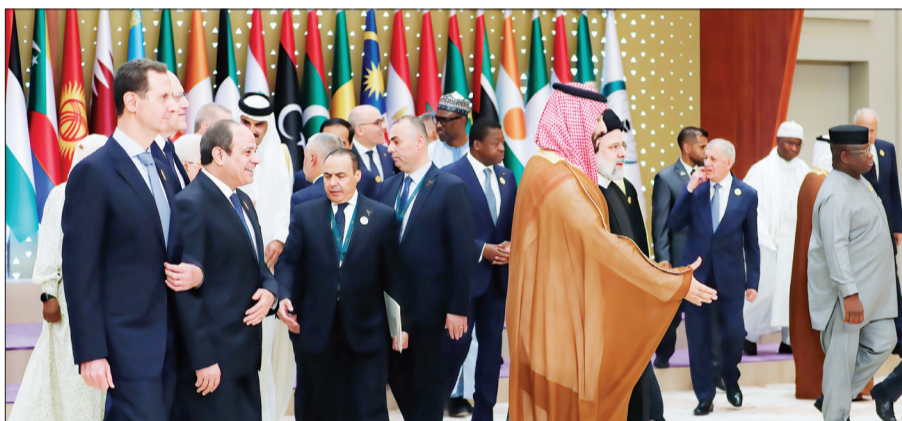
احسان پناه‌بر خبرنگار سازندگی

رئیس‌جمهور ایران پس از ۱۱ سال به عربستان سعودی سفر کرد. سیدابراهیم رئیسی و محمد بن سلمان در حاشیه اجلاس مشترک سران عربی - اسلامی با هم گفت‌وگو کردند