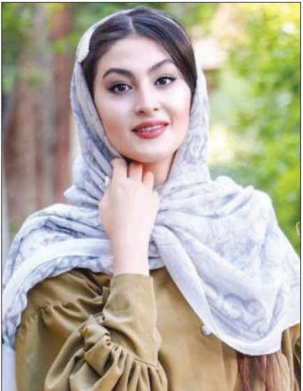
موضع‌گیری ماه بازار داغ انتقاد