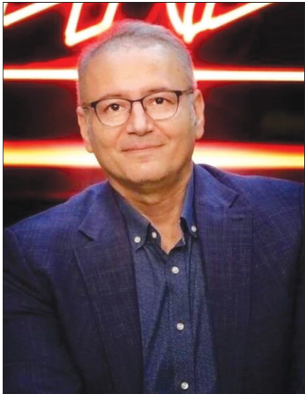
خداحافظی ماه جاودانی و محمدی مرام رفتند

سرانجام ماجرا | «جام‌جم» می‌تواند از جنجال‌ها برای اثرگذاری مطلوب بهره‌بردارد.