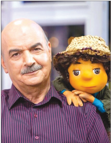
معمای ماه آینده مبهم طهماسب

سرانجام ماجرا | باید دید مهمان بعدی «با ضیا» چقدر صادق است!