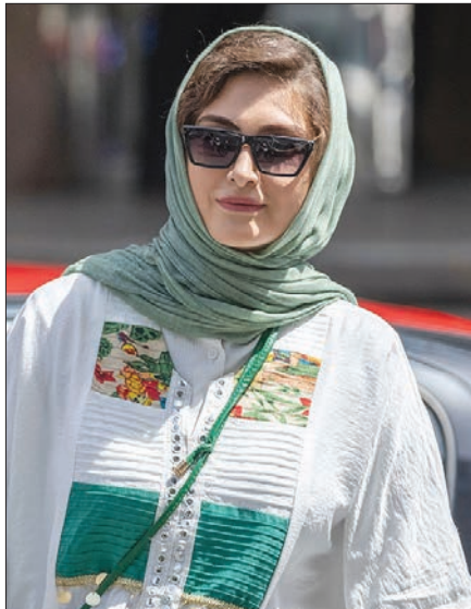
پر سر و صدای ماه تبلیغات خاص دو سریال

سرانجام ماجرا | متأسفانه در فصل جدید هم تصویربرداری لیگ‌برتر فوتبال در اغلب اوقات با دوربین‌های قدیمی و SD انجام می‌شود. ضعف‌های پوشش تلویزیونی اما همین یک مورد نیست و عدم هویت بصری ثابت، تبلیغات با فونت درشت، ضعف گزارش‌گران و... از جمله آنهاست.