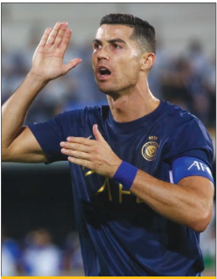
بی‌کیفیت ماه ضعف‌های مسابقه حساس

سرانجام ماجرا | تلویزیون توضیحی درباره سانسونر داور زن نداد اما قائم‌مقام شبکه مستند در صفحه مجازی نوشت: «آخرین پخش مستند «حدیث سرو» مربوط به چند سال پیش (سال ۹۶) است. طبیعی است که در آن زمان، نیز بازیکنی شبکه، امکان اصالت‌سنجی تصویر پخش شده از مرحوم سید کاظم عصار را نداشتند و گمان کرده است تصویر اصلی همانی است که به شبکه تحویل شده.»