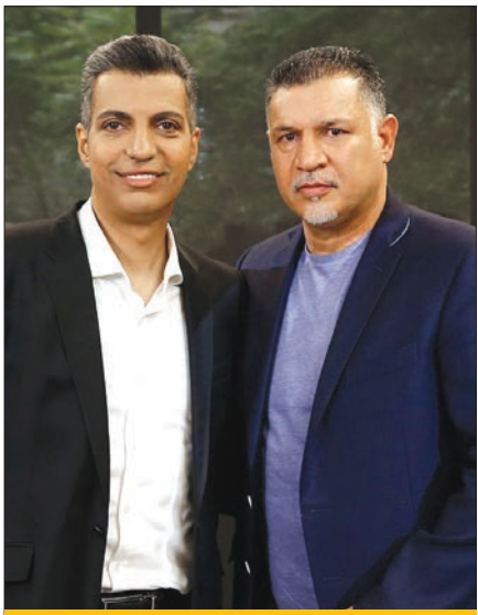
حمله ماه یکی علیه چهره‌ها

آنچه رخ داد | «جام‌جم» نام برنامه جدید شبکه یک است که با هدف بررسی مسائل کلان حوزه فرهنگ و رسانه ساخته شده. محمدصادق کوشکی مهمان قسمت اول با موضوع رفتارشناسی سلبریتی‌ها بود که نظراتش درباره چند چهره را بیان کرد. او گاهی اشاره مستقیم نداشت اما روشن بود روی کلامش با چه کسی است. او عادل فردوسی‌پور را یک مجری ورزشی دانست که حتی کلمات را نمی‌توانست ادا کند و بدون شایستگی به تلویزیون راه یافته بود؛ بارها در برنامه نود حرف سیاسی زده و مدیران وقت به او بساج دادند. این کارشناس درباره علی دایی هم عقیده داشت: «باید زمان بگذرد تا معلوم شود آیا او مثل تختی در یادها می‌ماند یا نه. کوشکی درباره مدیری هم گفت: «صداوسیما یک نفر را غول می‌کند و زورش به او نمی‌رسد تا جایی که مدعی می‌شود تلویزیون حق پخش برنامه‌ام را ندارد.» او و محمدرضا گلزار را چهره‌های دانست که در بازیگری، خوانندگی و نوازندگی فاقد شایستگی است. نظرش درباره نوید محمدزاده این بود: «همین بازیگری که اسمش را آوردید، اگر دو سال فیلم روی پرده نداشته باشد، فراموش می‌شود.»