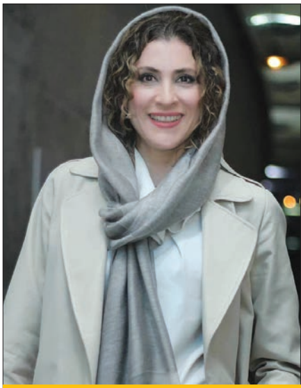
تصمیم ماه موقعیت جدید فریبرز و ویشکا

سرانجام ماجرا | فرشاد محمدی مرام، به تازگی به شبکه آپارات اسپرت اضافه شده و کارش را از این طریق ادامه می‌دهد. جاودانی اما فعلاً حرفه اجرا را کنار گذاشته است. چند هفته پس از جدایی او، حمید محمدی مجری سابق «فوتبال ۱۲۰» جایش را در «گزارش ورزشی» گرفت.