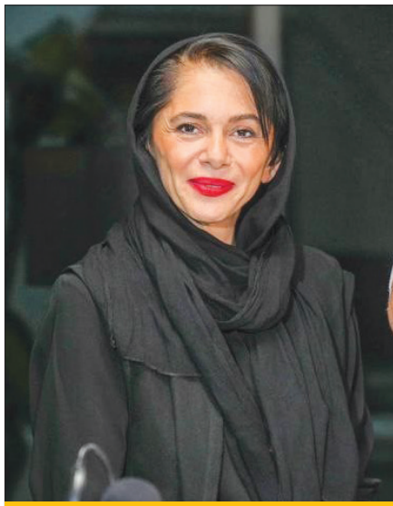
شفاف‌سازی ماه روایت خصوصی مستانه

سرانجام ماجرا | پخش دو سریال ادامه دارد و تبلیغ خاص خبری نیست.