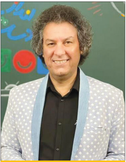
تلخ ماه وداع با هنرمند

سرانجام ماجرا | زندگی ادامه دارد و تلویزیون هم کمافی السابق پیش می‌رود.