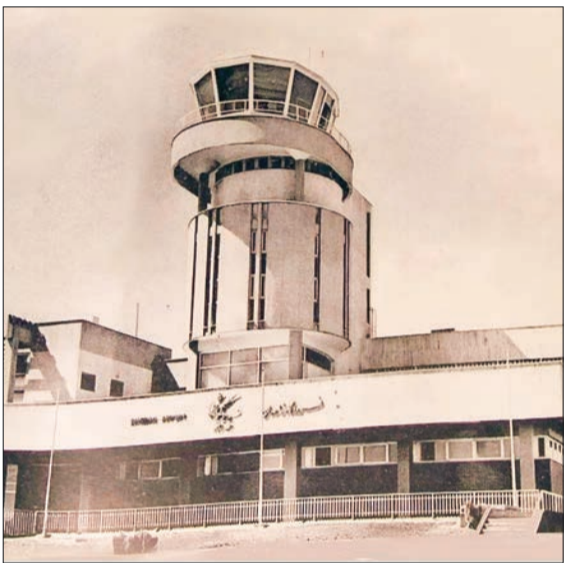
قاب نوستالژی ۲ فرودگاه بین‌المللی زاهدان - اوایل دهه ۵۰.

قاب تاریخ ۱ سربازان اشغالگر یعنی در خوزستان - پاییز ۱۳۵۹. (از صفحه علی ملیحی)