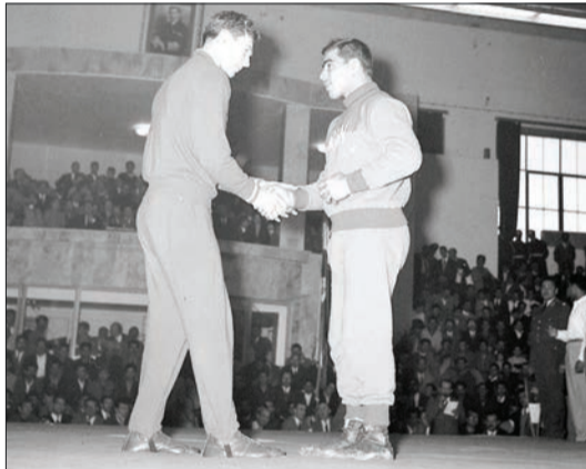
قاب مشاهیر غلامرضا تختی و الکساندر مدوید در مسابقات دوستانه در تهران - سال ۱۳۴۰

قاب تاریخ ۲ عکسی از بیان‌نوازی فخرالتاج معیری، نوه دختری ناصرالدین شاه را ببینید