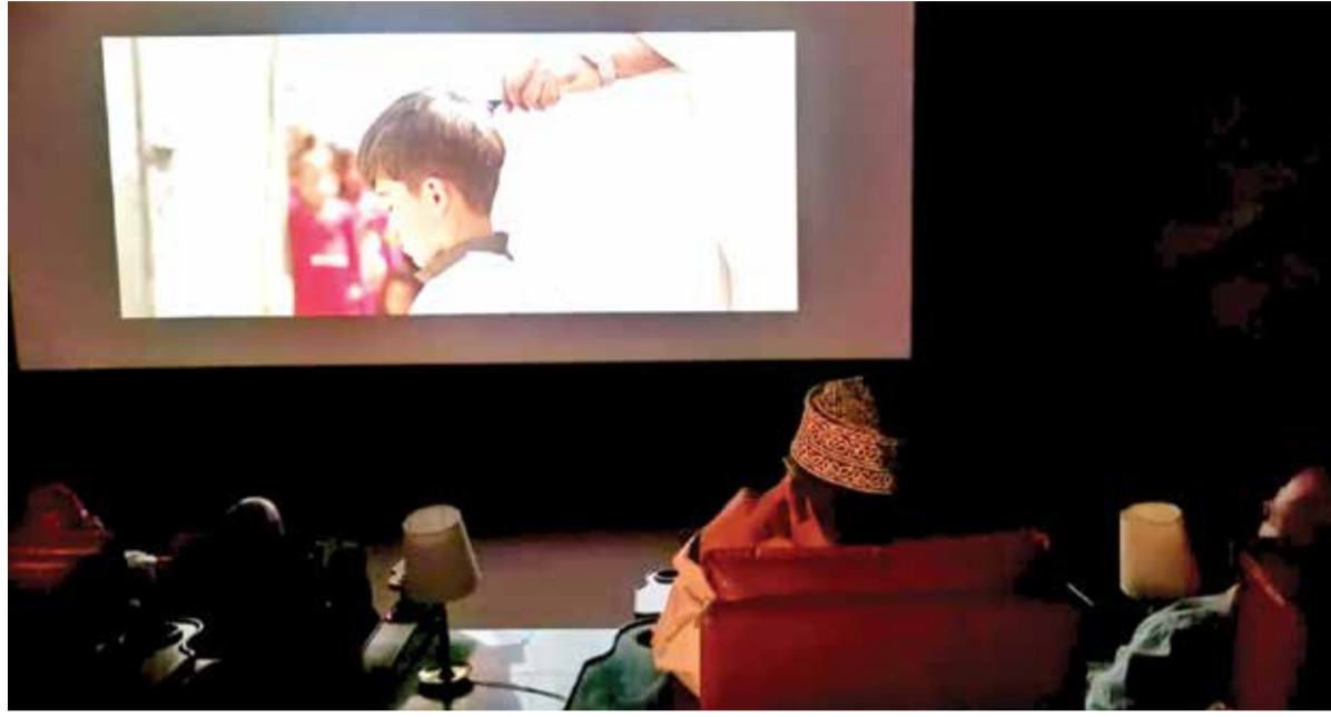
عرض فيلم «المبادلة» الإيراني العماني في سلطنة عمان

هناك متابعة كبيرة من قبل الجمهور العماني للأعمال الإيرانية وهذا يرجع للتأثير القوي لهذه الأعمال وخرج التعاون السينمائي بين إيران وعمان بعدد من الأعمال من ضمنها فيلم «مدرسة الإصلاح»، ومسلسل «يوميات مصبح» والفيلم الروائي الطويل «المبادلة».