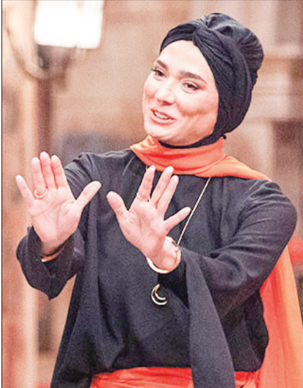
خط و نشان ماه

کارنامه امرالله صابری اغلب در نقش فرعی دیده شد که حضورش در «هامون» بیشتر در آذهن مانده. او پیش و پس از آن همکاری با داریوش مهرجویی را تجربه کرد. کارگردان صاحب سبک سینمایی ما که زندگی را جوری دیگر می‌دید و حرف‌های مهم را در قالبی همه‌فهم و دلنشین روایت می‌کرد. همسر نویسنده مهرجویی در فیلم‌های متأخر همسراه او بود. فردوس کاویانی بی‌حاشیه بود و آرام. او خالق شخصیت‌های دوست‌داشتنی زیادی است که چند مورد آن در آثار مهرجویی به‌بار نشست، مثل «بازار نشین‌ها» و «بانو». آتیلا پسیانی سال‌ها در سینما، تلویزیون و تئاتر درخشد و بازیگرانی تربیت کرد؛ مثل سحر دولتشاهی. در کارنامه اکبر قدیمی فیلم و سریال زیاد دیده می‌شود و عمده شهرتش با آثار تلویزیونی است؛ نمونه‌اش «خواب و بیدار».