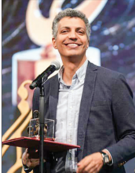
صف بندی ماه