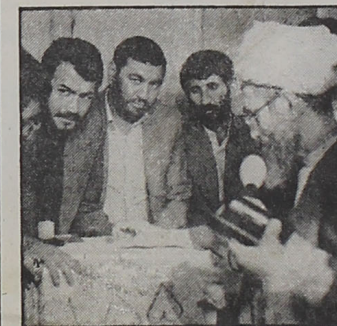
آیت الله مشکینی با شرکت در انتخابات مجلس شورای اسلامی، رای به گاندیدای مورد نظر خود را به صندوق انداخت.

بگذریم تا در همانجا شوهای رادیویی بناهندگان به دشمن کافر را با جانمایای از سخن امام توحید یاسخ کوئیم: - فقد بلغنی ان رجلا بن قیلک یسللون الی معاویه فلاناسف علی ما یفوتک من عددم، و یدهب عنک من مددم، فکفی لهم غیاولک منهنم شافیا. فرارهم من یقیه در صفحه ۴