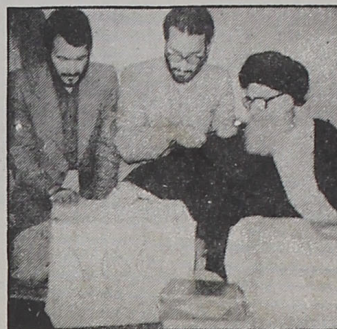
آیت الله العظمی گلپایگانی رای به نماینده مورد نظر خود را در صندوق سيار انتخاباتی که در منزل ایشان مستقر شده بود، انداخت. عکس آیت الله العظمی گلپایگانی را هنگام انداختن رای به صندوق نشان می دهد.

سردمداران نفاق با حذف بنی صدر خائن، گوشه چشم بیشتری به و خاورگان مارکسیست نشان داده، و از این راه راهنمای حرکت به سوی مسکو و سیاست "هم غرب و هم شرق" را زدن و بودهای های خارچ - نشین بر لزوم نزدیکی با آنان تاکید کردند و پلنوم تشکیل دادند و راستی که خوابشان آشفته مباد، گمان داشتند که می توانند رای عدم اعتماد مردم را در این شرایط نسبت به نظام انقلابی بگیرند. وجه کندی جزئی نگیزی است که دلگرایهای قدرت، حتی بر بی تعادلی و نفاست برخی عاقبت ناخبران هم سوار می شوند تا راه را بر سوار سپیده ببندد، و جفا زبون بزرگی است این انقلاب، نادر تابه بروجوش و خروش، عیارها را بسجد و بندیدند مکتب را در تمامی جان دلدادگان انقلاب و اسلام جاری سازد، بگذارید گرچه جملهای معترضه است اما از این کلام امیرالمومنین (ع)