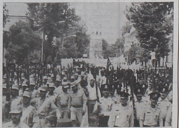
عکس و مطلب در صفحه ۴