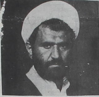
حجه الاسلام بهاری نماینده مردم ساری

ساری - حجت الاسلام بهاری نماینده مردم ساری در مجلس شورای اسلامی در مصاحبه پیرامون چگونگی دستیابی به خودکفایی کشاورزی مازندران، علل وضعیت نامطلوب آب مازندران، علل وضعیت نامطلوب آب زراعی، عوامل تبدیل اراضی مزروعی خودکفایی در مرکز استان را چگونگی