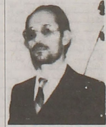
* شهید جواد سرحدی