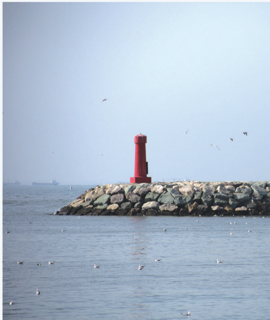
عکس روز | اسکله حقانی، خلیج فارس