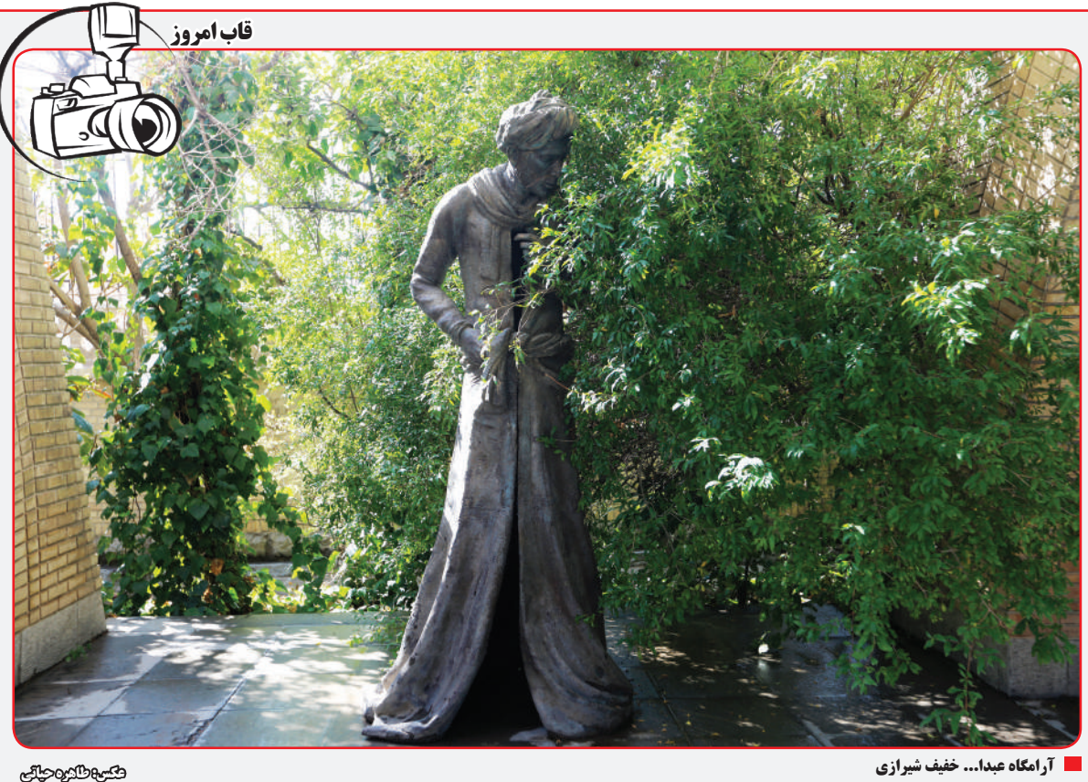
آرامگاه عید... خیف شیراز