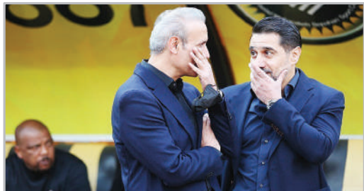
دیدار تیم‌های فوتبال سپاهان و پرسپولیس