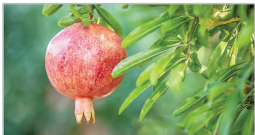
بر باشت انار - منطقه سیاب شهرستان کوهدشت