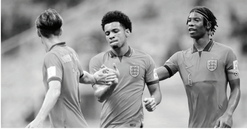
سخت صدرنشین می‌شود. نکته جالب این است که انگلیسی‌ها به نسبت ایران کمتر در جام جهانی این رده سنی شرکت کرده‌اند و برای پنجمین بار در این مسابقات حاضر می‌شوند. البته

به گزارش باشگاه خبرنگاران، تیم ملی فوتبال نوجوانان کشورمان از ساعت ۱۵:۳۰ روز سه‌شنبه دومین بازی خود در جام جهانی زیر ۱۷ سال را مقابل انگلیس در ورزشگاه بین‌المللی جاکارتا برگزار می‌کند.