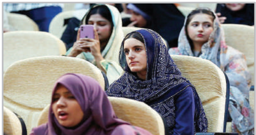
نخستین نشست بین‌المللی زنان ایرانی معماران تمدن‌ساز در نهضت ترجمه- همدان