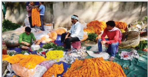
سنسور و شان هندی