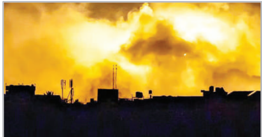
بمباران شدید هوایی نوار غزه از سوی اسرائیل