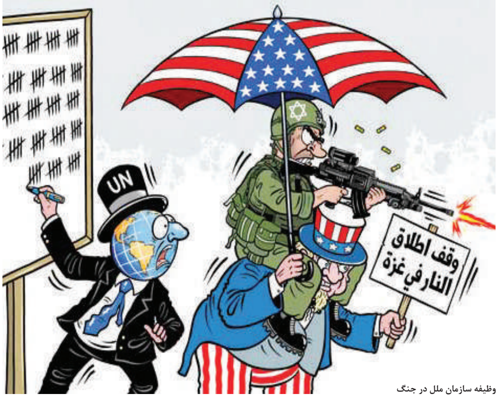
وظیفه سازمان ملل در جنگ