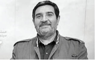
«تامیرا» نام جدیدترین اثر سینمایی شهریار

بهرانی، فیلم‌ساز شناخته شده سینمای ایران است. بهرانی آخرین بار با فیلم سینمایی «آفتاب نیمه‌شب» که روایتی از دستیابی نیروی هوای فضای جمهوری اسلامی ایران به فناوری موشکی بود، در سی و نهمین جشنواره فیلم فجر حضور یافته بود. او حالا برای دهمین تجربه بلند سینمایی‌اش به سراغ موضوعی عاشورایی رفته است. «تامیرا» اقتباسی سینمایی از رمانی با همین نام محسوب می‌شود که توسط صادق کریمیار به رشته تحریر درآمده است. این رمان، روایتی از حال و هوای شهر کوفه در ایام منتهی به واقعه کربلا را ارائه می‌دهد.