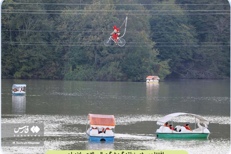
افتتاح پروژه منطقه گردشگری الیمالات مازندران