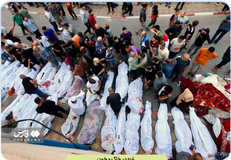
غزه در خاک و خون