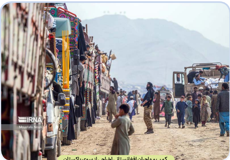
کمپ مهاجران افغانستانی اخراجی از سوی پاکستان