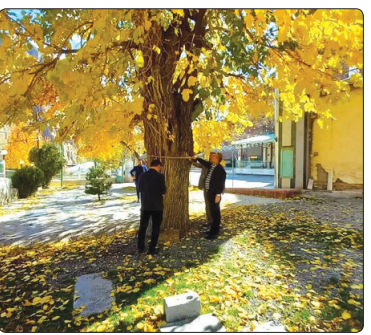
ناملموس شامل آداب و رسوم محلی بخش آسارا برای ثبت در فهرست آثار میراث ملی شناسایی شد.

رئیس میراث فرهنگی شهرستان کرج گفت: پرونده ثبتی درختان کهنسال در فهرست میراث طبیعی ملی در حال انجام است.