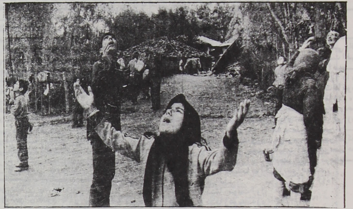
ای خدای آرام بخش آسمان وزین، ای بهترین مردم، ما در ارباب!