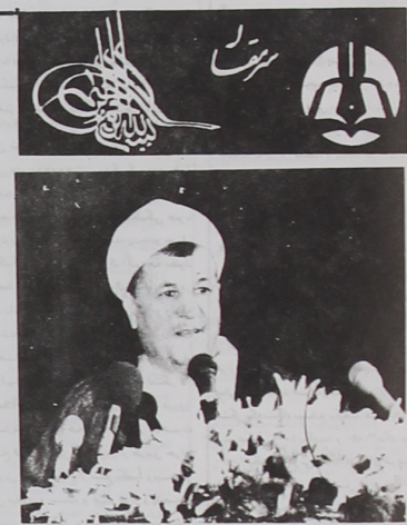
سفر پر خیر و برکت رئیس جمهور کشورمان به استان زرخیز مازندران