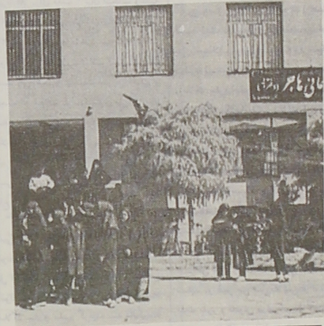
مجوز تأسیس مدارس غیرانتفاعی تنها به اقبال فرهنگی داده می‌شود

آموزش و پرورش را در روند فعالیت‌های عمده دستگاه متبوع ذکر کرده افزود: در سال گذشته برای اجرای طرح‌های تحقیقاتی مبلغ ۳ میلیون و ۵۰۰ هزار تومان اعتبار تخصیص یافت که این میزان در سال جاری ۷ میلیون و ۲۰۰ هزار تومان بالغ شد و تاکنون نیمی از ۳۹ طرح تحقیقاتی ارائه شده در زمینه‌های مختلف افت تحصیلی، جلوگیری از هجانات روحی، فراگیری امر واجب نماز و غیره، ۲۶ طرح مورد تصویب قرار گرفت و همچنین عملیات اجرایی ۱۵ طرح در این رابطه به پایان رسید.