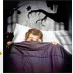
نوع هراس: ترس از تاریکی

علت: دلایل متعددی برای نیکتوفوبیا وجود دارد از جمله تجربه منفی مورد حمله واقع شدن در مکان تاریک، از دست دادن بینایی، ناامنی، آسیب پذیری بودن در تاریکی و تهدیدهایی که ممکن است در کمین باشند.