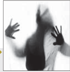
نوع هر اس، ترس از فضای باز