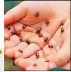
نوع هراس: ترس از حیوانات و حشرات

● علت: ترس از حیوانات یسا زوفوبیا به ترس شدید و غیرقابل کنترل از حیوانات گفته می شود. دلیل اصلی آن هنوز ناشناخته است اما بیشتر افراد به دلیل تجربیات منفی، رفتارهای آموخته شده و ژنتیک از یک نوع حیوان می ترسند. ● علائم: احساس ترس و دلپره، افزایش ضربان قلب، تعریق زیاد، لرزیدن، تنگی نفس، سبکی سر و احساس ضعف در دقه سینه و حالت تهوع و در کودکان نیز ثابت ماندن (به اصطلاح یخ زدن)، گریه کردن، چسبیدن به کسی و بد خلقی کردن.