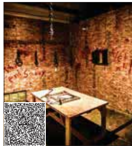
نشانی: شهرک گلستان، بلوار امیر کبیر، بلوار کاج، بنفشه سوم