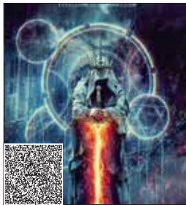
نشانی: یافت آباد، بزرگراه آیت الله سعیدی، نیش بلوار معلم