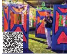
نشانی: سعادت آباد، بالاتر از میدان کتاب، مجموعه پرواز