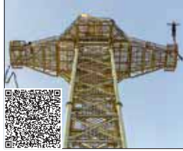
نشانی: بزرگراه یادگار امام، بلوار پیام، جنوب شرقی میدان بهرود