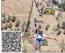
نشانی: بزرگراه شیخ فضل الله نوری، برج میلاد