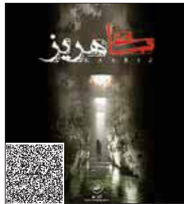
نشانی: خیابان نلسون ماندلا (جردن)، بالاتر از بل میر داماد