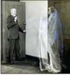
نوع هراس: ترس از ارواح

● راهکار غلبه: پرهیز از دیدن فیلم‌های وحشتناک، دوری از افراد ترسو و پرکردن اوقات بیکاری بهترین راهکارهای غلبه بر ترس از ارواح و جن است اما اگر بخواهیم به فکر درمان این نوع از ترس به صورت علمی باشیم، باید به پزشک مراجعه کرد. برخی از افراد مبتلا به فوبیای خاص، مانند ترس از ارواح، از احساسات خود خجالت می‌کشند و از درمان اجتناب می‌کنند. اما مواجهه درمانی، دارو درمانی و درمان شناختی رفتاری از جمله درمان‌های رسمی فوبیا روح و جن است که با مراجعه به روانپزشک یا روانشناس می‌توان به آن دست یافت. تکنیک‌هایی از جمله مدیتیشن و تمدد اعصاب و یوگا نیز مفید هستند.