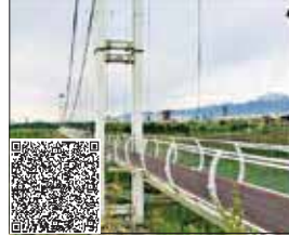
نشانی: بزرگراه آیت الله حکیم، فاز دوم بوستان نهج البلاغه