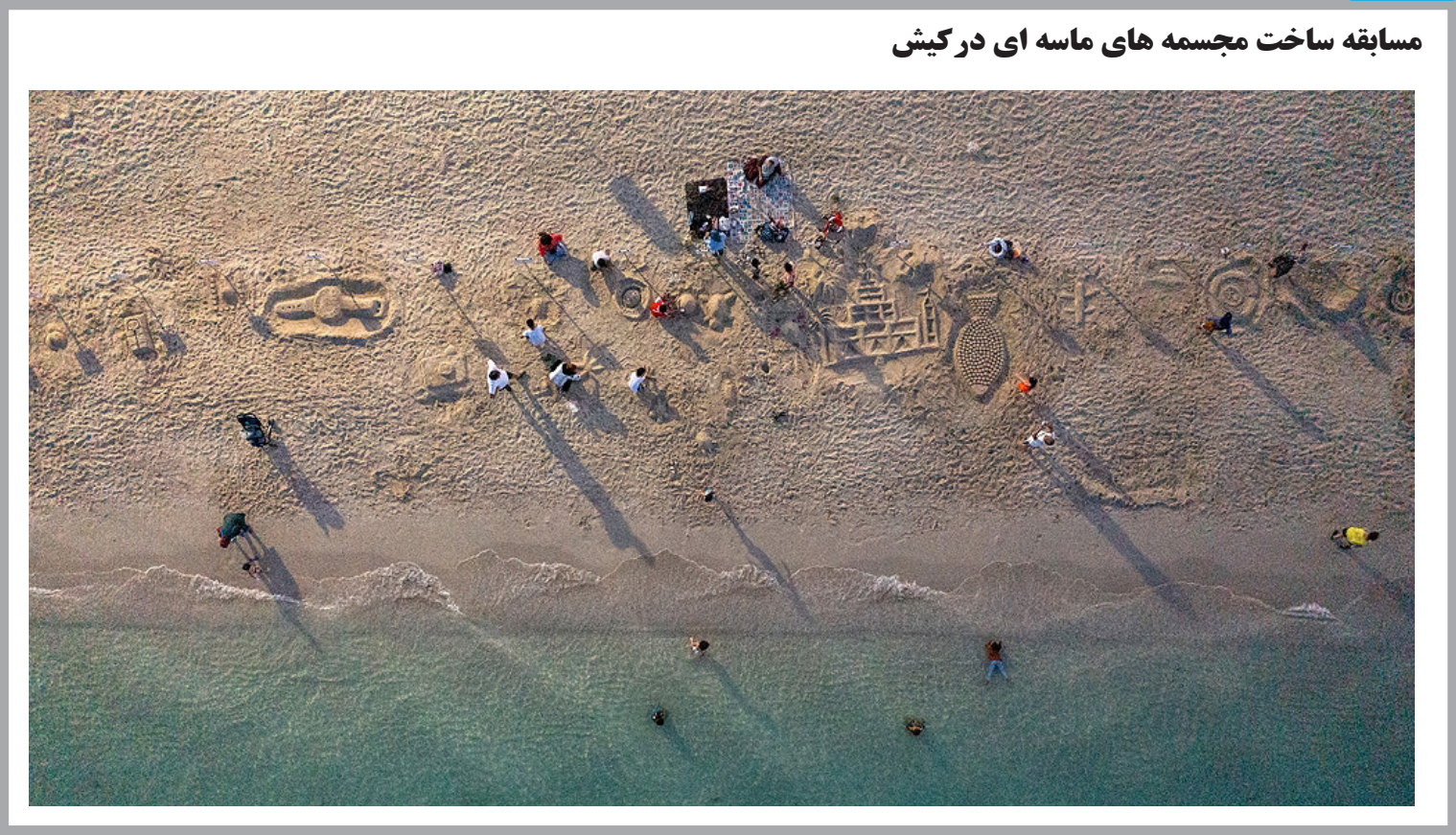
مسابقه ساخت مجسمه های ماسه ای در کیش