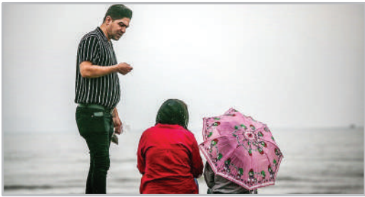
بارش باران پاییزی - بندرعباس