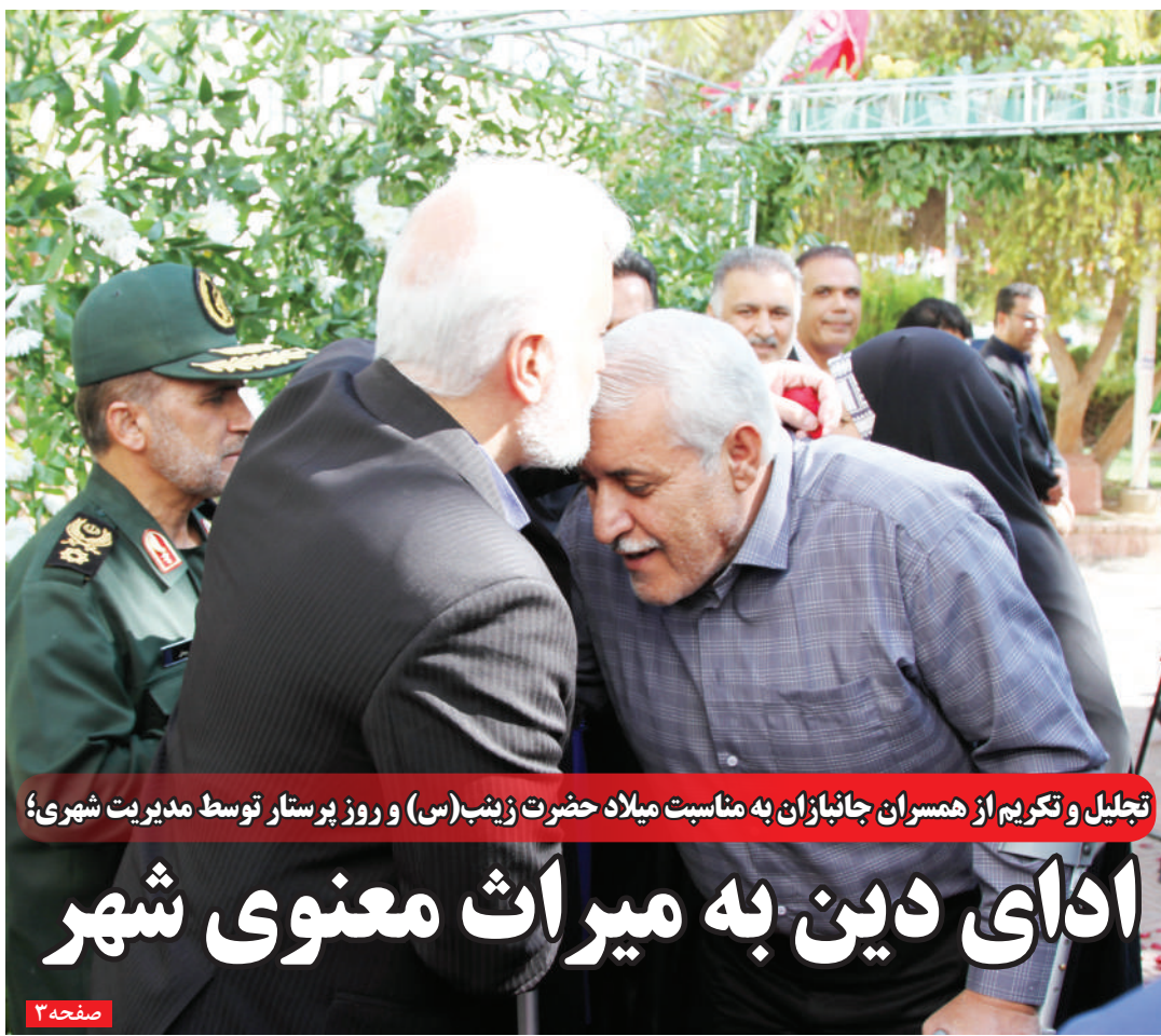
تجلیل و تکریم از همسران جانبازان به مناسبت میلاد حضرت زینب(س) و روز پرستار توسط مدیریت شهری؛