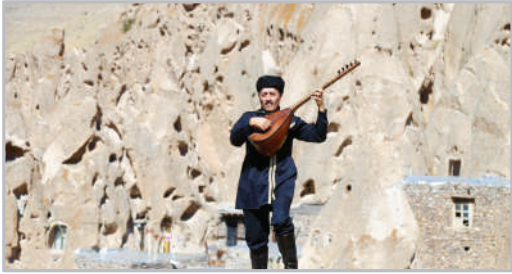
روستای صخره‌ای کندوان