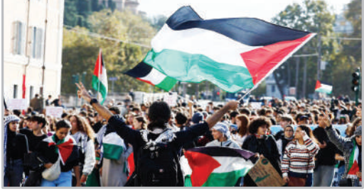
تظاهرات دانشجویان ایتالیایی در حمایت از غزه