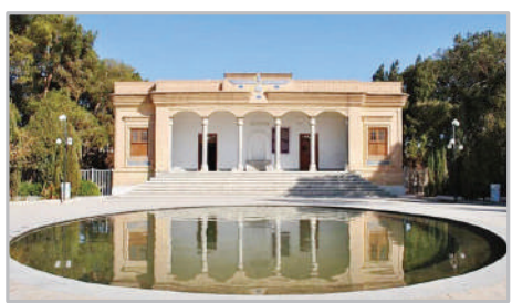
آتشکده بهرام یزد

ساختمان آتشکده وهرام یزد جلب کند. این سفرها چهار بار با کشتی‌های بخار از طریق اقیانوس هند و یک بار با پای پیاده و شستر از ریگزارهای بلوچستان ایران و پاکستان انجام شد. طبق نوشته‌ها و نقل قول‌های تاریخی به نظر می‌رسد در زمان حکومت پادشاهان ساسانی، سه آتشکده به‌دلیل قدمتشان از شکوه و اهمیت بالایی برخوردار بودند: آتشکده آذر گشنسب یا آذرگشسب در شهرستان تکاب در تخت‌سلیمان، آتشکده آذر برزین‌مهر در روستای فشنتق خراسان رضوی و آتشکده کاربان یا آتشکده آذرفرنبغ کاربان فارس در روستای کاربان از توابع جویم لارستان.