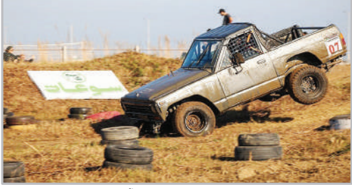
چهارمین دوره مسابقات قوی‌ترین مردان آفرود ایران - رودسر