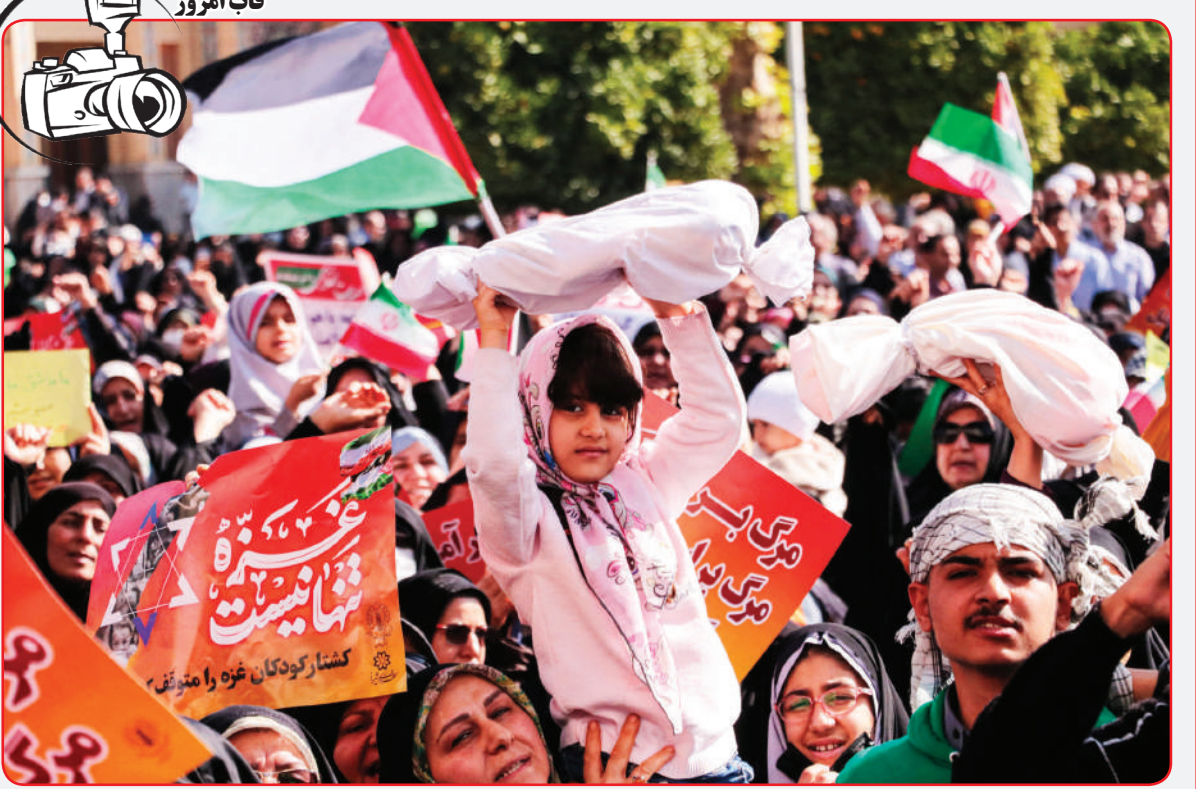
حمایت از کودکان بی‌دفاع غزه