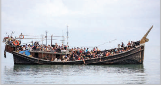
قایق حامل پناهجویان روهنجایی