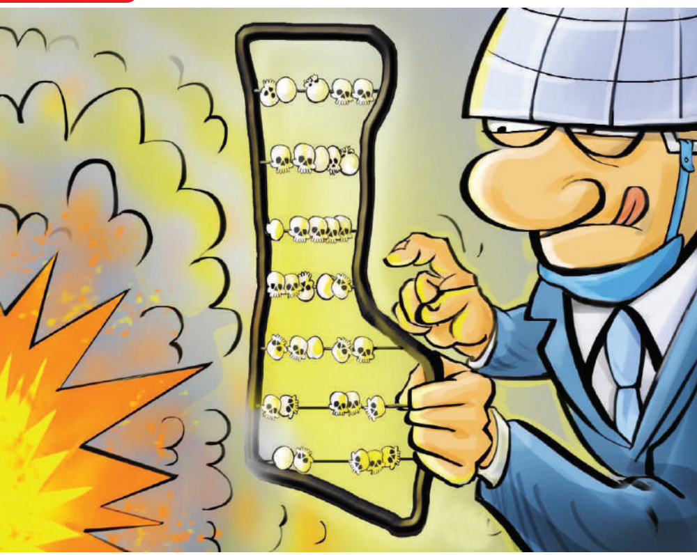
چرتکه انداختن سازمان ملل