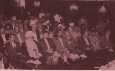
شرکت‌کنندگان در مراسم افتتاح شبکه استانی سیمای مرکز مازندران

برنامه‌های شبکه استانی با تلاش دست اندرکاران این شبکه بسیار جذاب، شاداب و پرمحتوا است