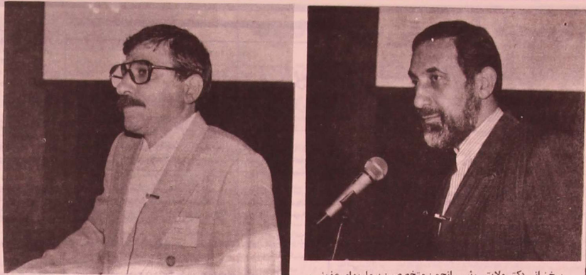
سخنرانی دکتر و لایتنی رئیس انجمن متخصصین بیماریهای عفونی و گرمسیری ایران در مراسم آغاز کنگره