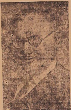
لیک ساکسی - ساعت ۱۸ و ۵ دیروز

آقای سبسی پیشنهادی را که در این باب تهیه کرده