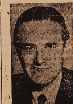
آقای اورل هارین مستر مشاور مخصوص مستر ترومن رئیس جمهوری امریکا که برای حل مسئله نفت ایران بلندن آمده است